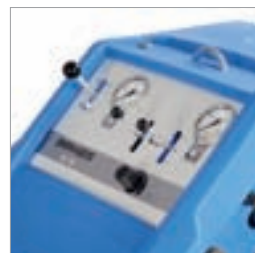
Ergonomisk plasserte betjeningsanordninger