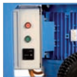
Elektrokomponenter av høy kvalitet gjør den sikker