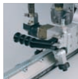
Veggsaghode monteres raskt og enkelt