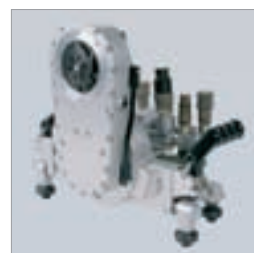
Veggsaghode av høyfast aluminiumslegering, tannhjuls-svingarm og rulleføringer