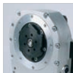
Svingarm med hurtigkoblingsflens-feste