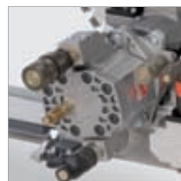
Hovedmotor med lekkoljettkobling