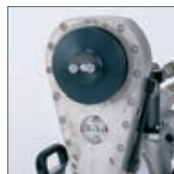
Girsvingarm med hurtigkoblingsflens for enkelt bladskifte