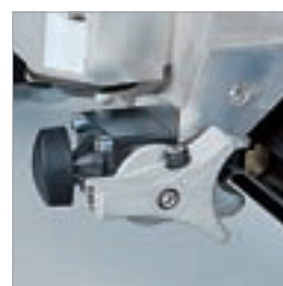
Glideføring med ergonomisk låsesystem og fininnstilling